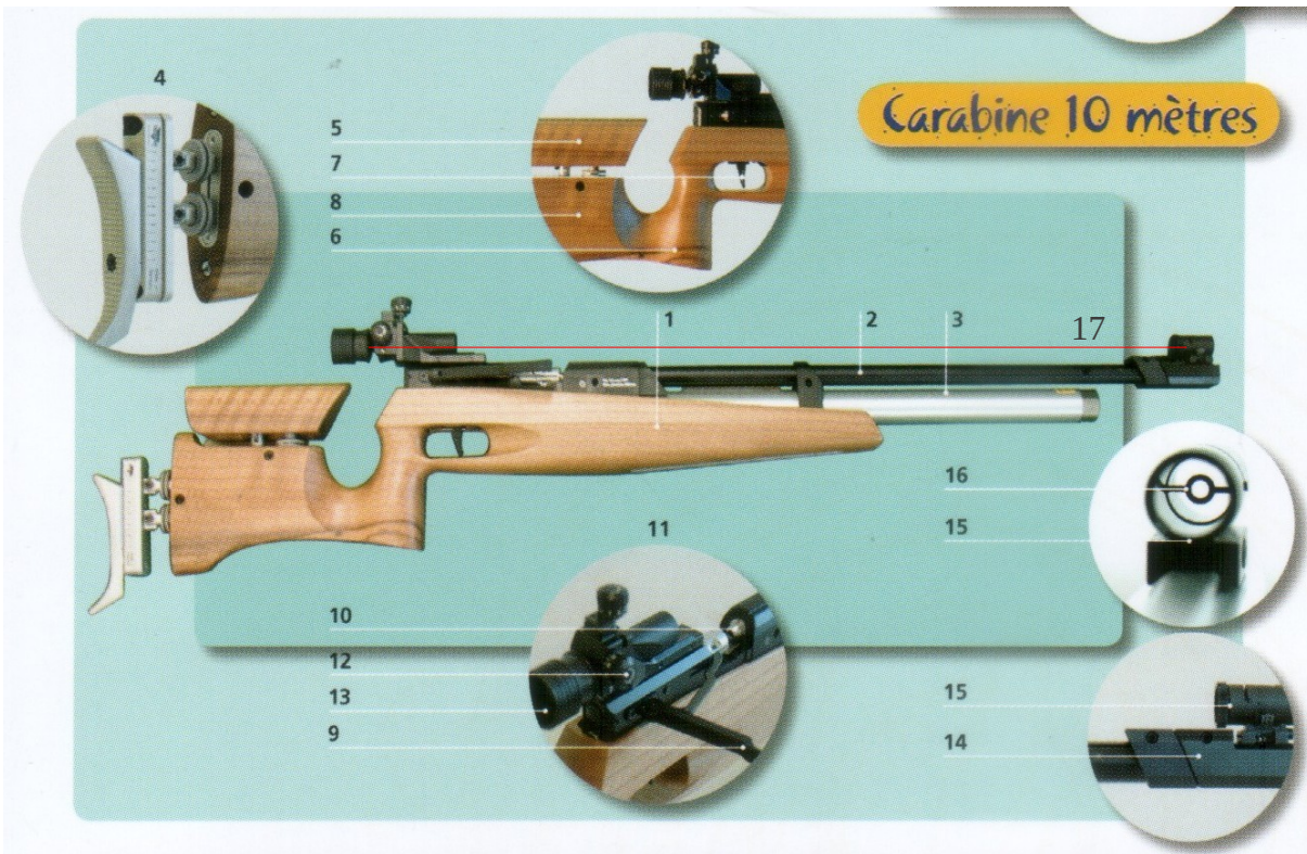
Illustration 1: Extrait du Guide du formateur FFTir page 17